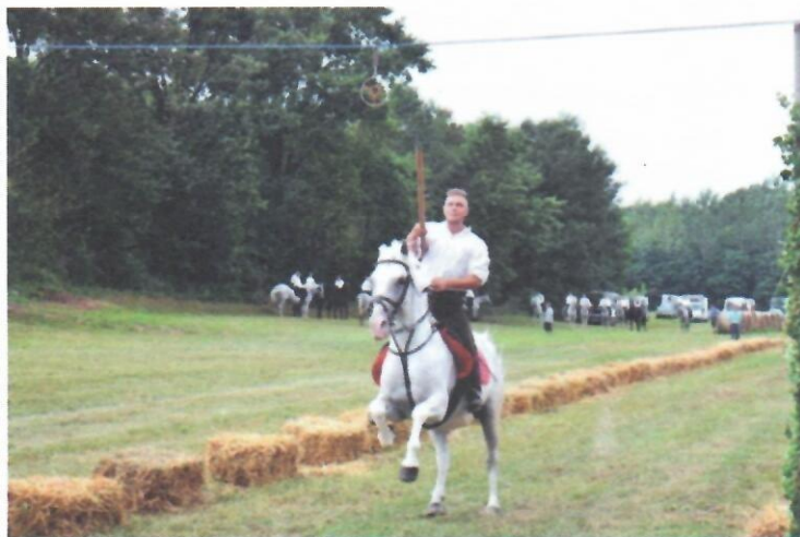
Slika 1. Šokačka alka; Autor: Danijel Geošić

Prema brojnim pisanim zapisima na prostoru Hrvatske postoji tradicija konjičkih viteških igara. One se mogu promatrati kao nematerijalna kulturna baština ali i kao sportska baština budući da u sebi sadrže elemente koji su karakteristični za sport, kao što su natjecanje, pravila, vještine ali i zabavu. U posljednjem su desetljeću u turističkoj ponudi Hrvatske sve prisutnije različite konjičke viteške igre te se opravdano postavljaju pitanja vezana za njihovu izvornost/autentičnost i pravilnu interpretaciju. Iako turizam može pridonijeti promociji, očuvanju i unaprjeđenju kulturne baštine upitna je prezentacija autentičnosti i izvornosti nematerijalne kulturne baštine.