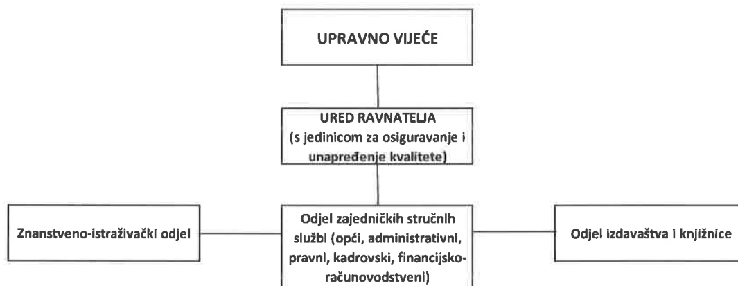
Slika 3. Shematski prikaz organizacijske strukture Instituta za turizam (organigram)

Sukladno čl. 21. Statuta Instituta za turizam, za obavljanje djelatnosti u Institutu su ustrojene sljedeće organizacijske jedinice (Slika 3.):